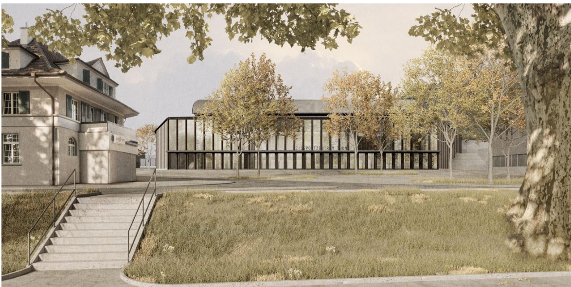
Ansicht von der Aare

Das Eissportzentrum erhält eine neue Identität. Der Vorplatz wird zu einem zentralen Begegnungs- und Freizeitort. Die Nähe zur Aare und zur Stadtmauer kann wieder wahrgenommen werden und der Platz wird aufgewertet. Die grosszügige Treppe, die im Projekt das Parkhaus von der Kunsteisbahn optisch trennt, verbindet den Vorplatz mit dem öffentlichen Viehmarktplatz und bietet damit neue Synergiemöglichkeiten. Das äussere Erscheinungsbild präsentiert sich aareseitig mit einem gut erkennbaren Glasvolumen, welches die Eingangshalle ist. Es entsteht eine durchgehende Fassade in Holz und Beton, welche die ganze Anlage als abgeschlossenes Ganzes erscheinen lässt.