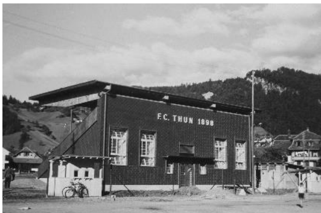
1949 Tribüne

Das Grabengut ist seit fast 100 Jahren Begegnungs-, Freizeit- und Sportstätte. Die Sanierung der Kunsteisbahn und die Attraktivierung des Vorplatzes schaffen die Grundlagen für die Fortsetzung dieser Tradition und stärken die städtebauliche Identität des Stadtteils. Schon 1925 wurde der «Budeplatz» versuchsmässig zu einer Eisbahn vereist und zwei Jahre später in den Wintermonaten «offiziell» der Bevölkerung zur Verfügung gestellt. Parallel dazu wurde 1927 der Fussballplatz des FC Thun eingeweiht. Es folgte 1949 der Bau einer Tribüne, und schon bald entwickelte sich die Idee einer Kunsteisbahn.